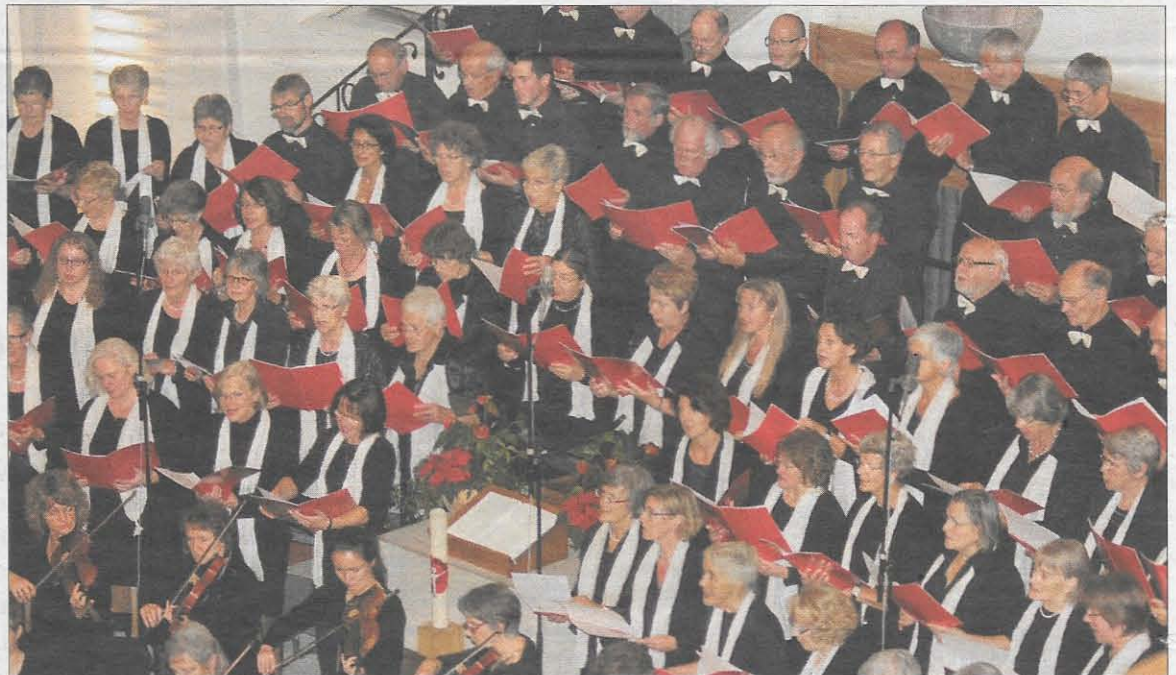
Der Singkreis Bäretswil-Bauma zelebrierte die Schweizer Landeshymne in Bäretswil.

BÄRETSWIL Am vergangenen Wochenende feierte der Singkreis Bäretswil-Bauma den Startschuss in die vier Konzerte umfassende Tournee zum 50-Jahr-Jubiläum der Schweizer Landeshymne. Vor Ort war auch der Wernetshäuser Bundesrat Ueli Maurer, der zum Anlass eine Ansprache beisteuerte. Gesichtet wurde zudem alt Bundesrat Christoph Blocher, der die Tournee als Hauptsponsor überhaupt ermöglicht hat. Die reformierte Kirche war zum Grossanlass praktisch bis auf den letzten Platz besetzt. Der Chor mit Solisten und Orchester zeigte sich dabei von der besten Seite. (reg)