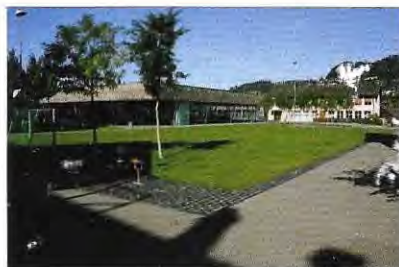
Mehrzweckhalle und Schulhaus Dorf Trakt C