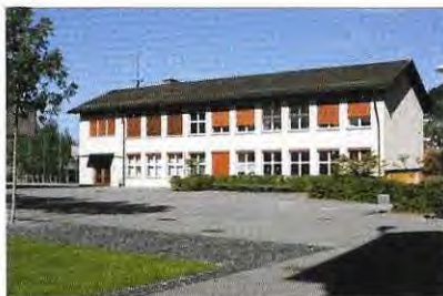
Schulhaus Dorf Trakt C