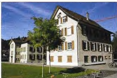
Schulhaus Dorf Trakt A und B