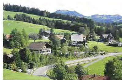
Ghöch mit Restaurant Berg

Erich Wälty, Schulhausstrasse 9 8344 Bäretswil info@waelty-innendekorationen.ch