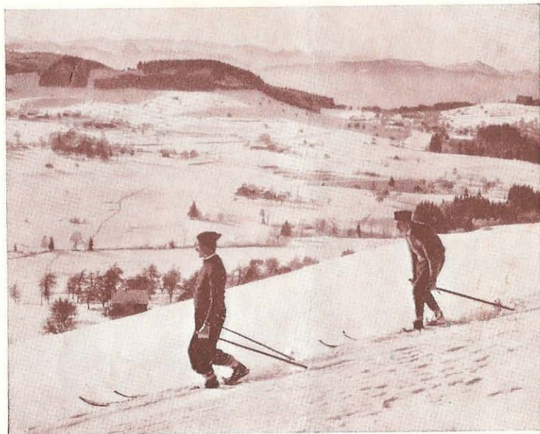
Herrlicher Ausblick vom Jakobsberg