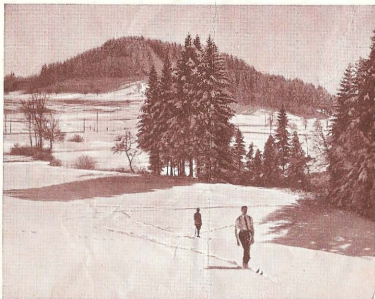
Im Schnee und an der Wintersonne

Dank der gesunden, nebelfreien Höhenlage (700-1083 Meter über M.), der schneesicheren Winter, der geringen Entfernung von den großen Städten Zürich und Winterthur, hat sich Bäretswil innert wenigen Jahren zu einem bevorzugten Wintersportplatz entwickelt. Die Mannigfaltigkeit und die weiten Ausmaße der Skihänge, die Auswahl der verschiedenen Touren im Gebiete der Allmannkette, die Sprungschanze ob dem Bergdörfchen Wappenswil, die verschiedenen Schlittelbahnen, die wintersportlichen Veranstaltungen genügen, die Zahl der Gäste stets zu steigern. Wenn das Tiefland von düstern Nebelschleiern eingehüllt ist, badet sich das Hochland am Allmann im herrlichsten Wintersonnenglanz. Wer sich einige Tage oder Wochen Ferien erlaubt, findet hier oben in Gasthäusern, Restaurants und Skihütte gute Unterkunft und Verpflegung bei mäßigen Preisen.