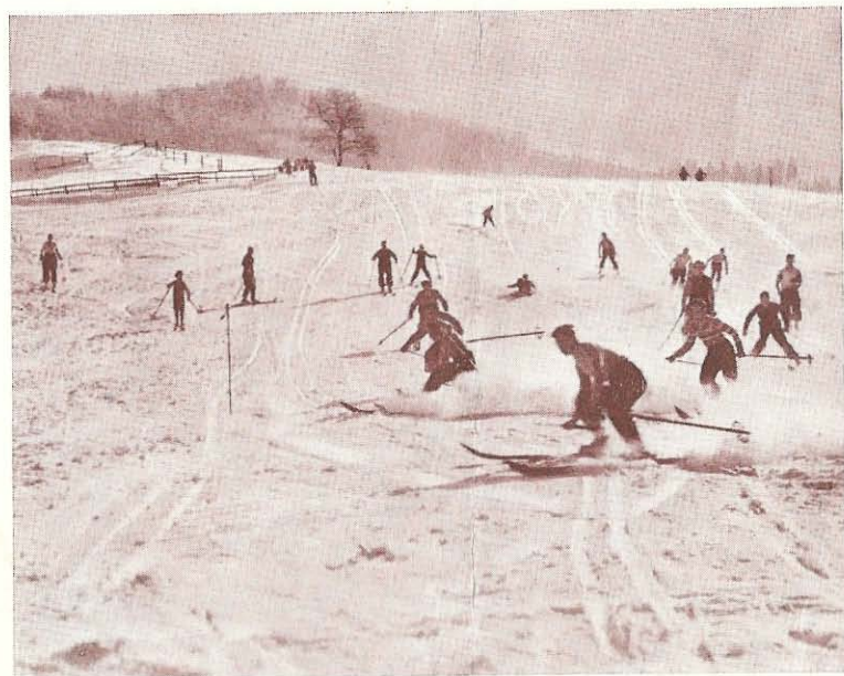
An einem der herrlichen Uebungshänge