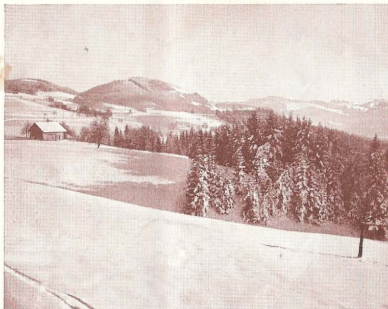
Blick gegen den Bachtel und die Glarneralpen