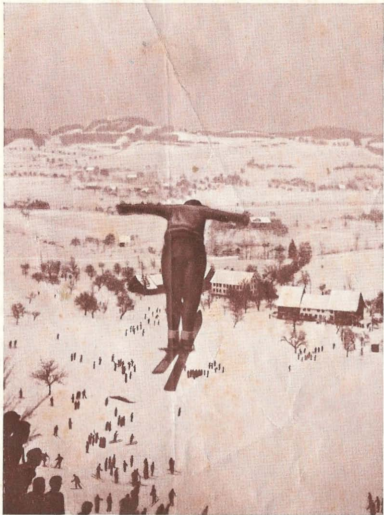
Sprungschanze Allmann mit Blick gegen den Jakobsberg

DER IDEALE WINTERSPORTPLATZ IM ZÜRCHER OBERLAND